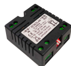
09369 Dimmer 1CH DALI2-PUSH-0/1.10V 24V max11A